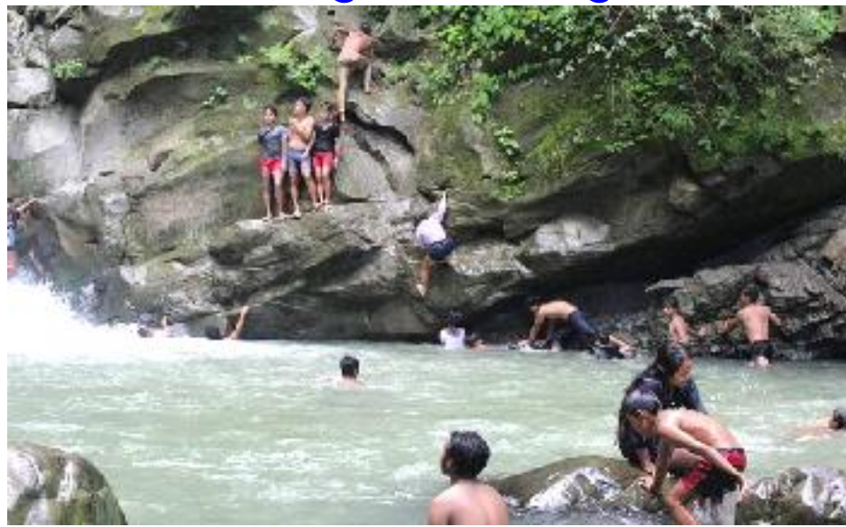
कोरोना भाईरस सुरुहुनु अघि उअगाडि भुतिया दहमा पौडी खेल्दै पौडी पारखिहरु।

विशेषगरी गर्मी महिना बैशाख, जेठ र असारमा पौडी खेलका लागि सयौं युवायुवतीहरु यहाँ भेला हुन्छन्। कन्चिरावासीका अनुसार